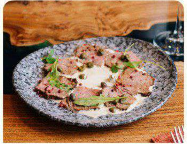
Ростбиф с соусом Вителло тоннато