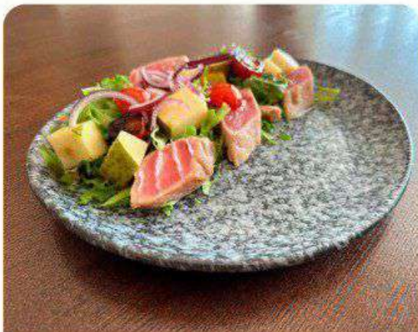
Салат с тунцом и сезонной грушей