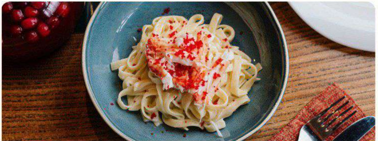
Паста с камчатским крабом