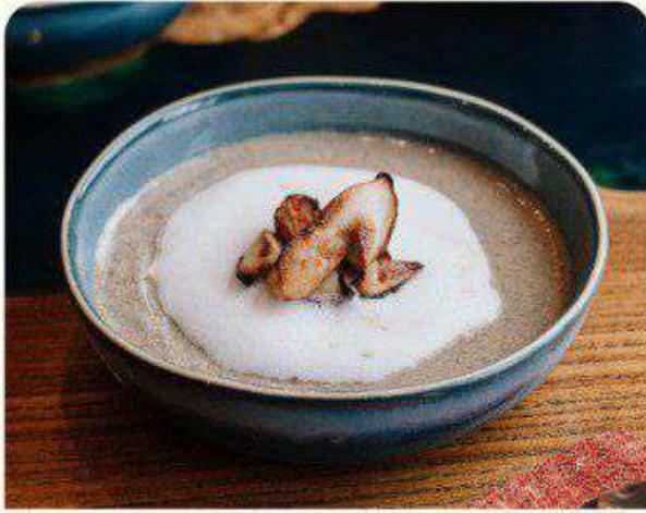
Крем-суп из лесных грибов